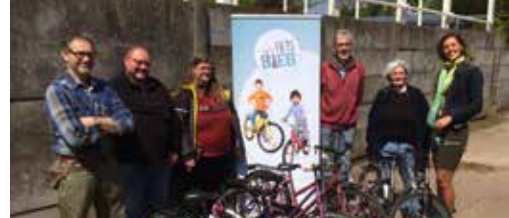
Binnenkort ook fietsbieb in Herentals? p. 3