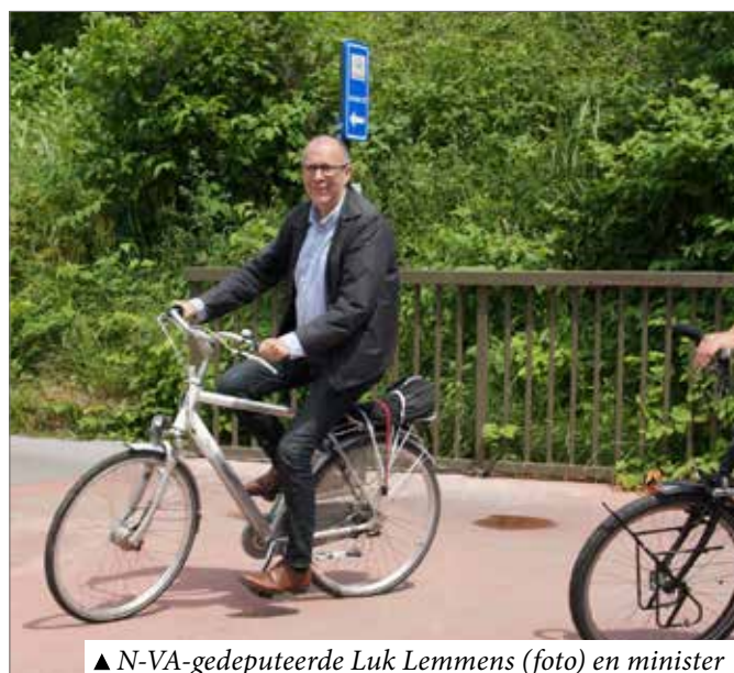
▲ N-VA-gedeputeerde Luk Lemmens (foto) en minister Ben Weyts investeren volop in Herentalse fietspaden.

Geweldig nieuws dus voor Herentalse fietsers. Fietsen op de gewestwegen wordt dankzij deze Vlaamse en provinciale investeringen vlotter en veiliger. Jammer dat het Herentals stadsbestuur niet de kaart trekt van veiliger en aangener fietsen in