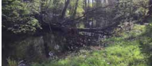
Erbarmelijke toestand van onze parken p. 2