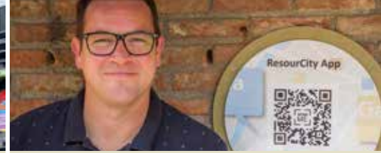
App laat jongeren kennismaken met chemie (p.3)