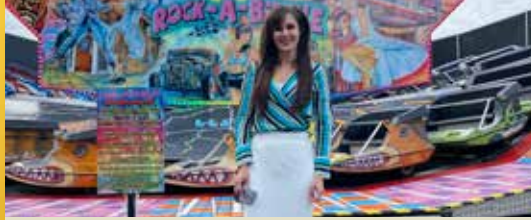
Meer dan 10.000 bezoekers op septemberkermis (p.2)