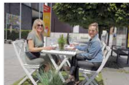
▲ In mei gingen de terrassen terug open. In juni volgde de rest van de horeca. Succes aan alle Herentalse horecanten. Wij duimen mee voor een topzomer.