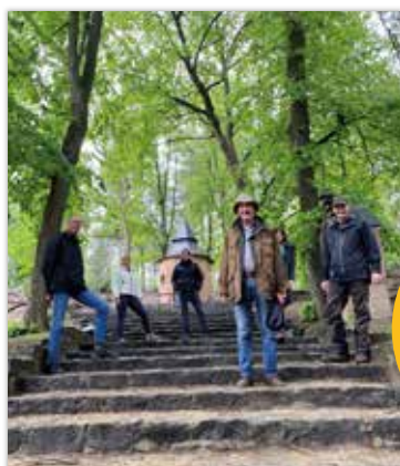
◀ Van half maart tot eind juni stippelde de toeristische dienst elke week een ‘Wandeling van de Week’ uit in Herentals, Noorderwijk of Morkhoven. Knap werk! Wij genoten tijdens één van de wandelingen volop van de natuur rond de Kruisberg.